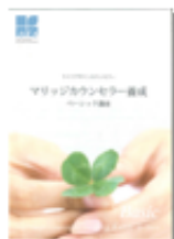
オリジナルテキスト

わかりやすいオリジナルテキストと、丁寧な講義で最新の業界情報、法律知識を習得していただけます。