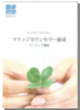
オリジナルテキスト

わかりやすいオリジナルテキストと、丁寧な講義で最新の業界情報、法律知識を習得していただけます。