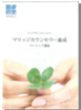
オリジナルテキスト

わかりやすいオリジナルテキストと、丁寧な講義で最新の業界情報、法律知識を習得していただけます。